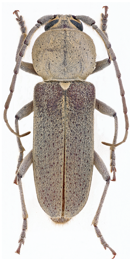
Fig. 1 - Hesperophanes melonii n. sp., Holotypus ♂.

Non si è ritenuto necessario realizzare un confronto diretto fra la nuova specie e materiale tipico delle due specie orientali di