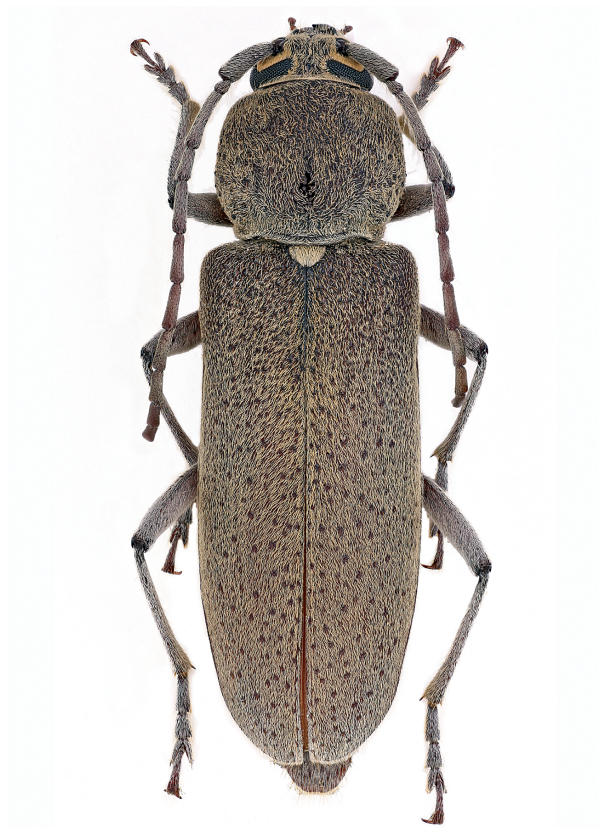
Fig. 2 - Hesperophanes melonii n. sp., Paratypus ♀.

Paratypi: stessa località dell’Holotypus e stessi raccoglitori, 2 ♂♂, 23.VI.2012 (coll. Fancello); 1 ♀, 23.VI.2012 (coll. Faggi, Prato); 1 ♂ e 1 ♀, 6.VII.2012 (coll. Malmusi, Modena); 1 ♂, 13.VII.2012 (coll.