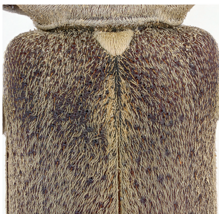
Fig. 3 - Hesperophanes melonii n. sp., Holotypus ♂, disco delle elitre: particolare della pubescenza.

Elitre densamente granulate alla base, poco allungate, con la maggiore larghezza nella regione omerale, a lati paralleli nella prima metà anteriore, ma distintamente sinuate in corrispondenza delle anche metatoraciche, regolarmente ristrette in addietro e ad apice largamente arrotondato. Scutello triangolare, ma arrotondato ai lati e non appuntito all'apice. Pubescenza nel ♂ (fig. 3) coricata, sericea, discretamente lunga e robusta, densa ma non tale da nascondere i tegumenti, grigio-biancastra, formata da setole leggermente più robuste di quelle del pronoto; nella ♀ la pubescenza è di norma appena più giallastra e le setole sono della stessa forma e lunghezza di quelle del protorace. In entrambi i sessi sono presenti sparsi punti setigeri visibili su tutta l'elitra, provvisti di setole bruno-gialle, semierette, più robuste e lunghe delle setole sericee della pubescenza coricata. Scutello fittamente pubescente di setole bianche.