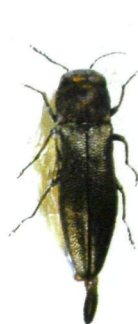
Foto1: Agrilus margotanae n. sp., ♂, Holotype. Länge 3,9 mm