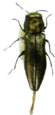
Foto2: Agrilus margotanae n. sp., ♀, Allotype. Länge 4,6 mm