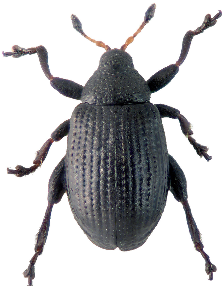
Fig. 10 - Rhamphus monzinii n. sp., Holotypus ♂, Giaglione, prov. Torino, habitus.