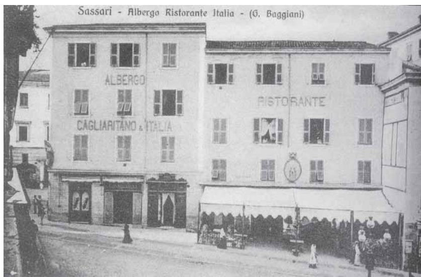
Fig. 5 – L’Albergo Cagliaritano e Italia in Piazza Azuni a Sassari, in una cartolina d’inizio Novecento.