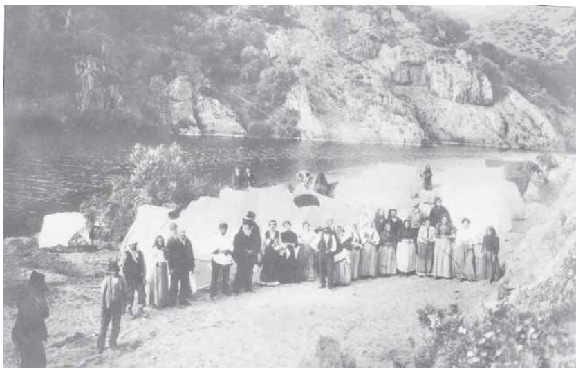
Fig. 7 – Le terme di Casteldoria (Santa Maria Coghinas, SS) in un'immagine di fine Ottocento.