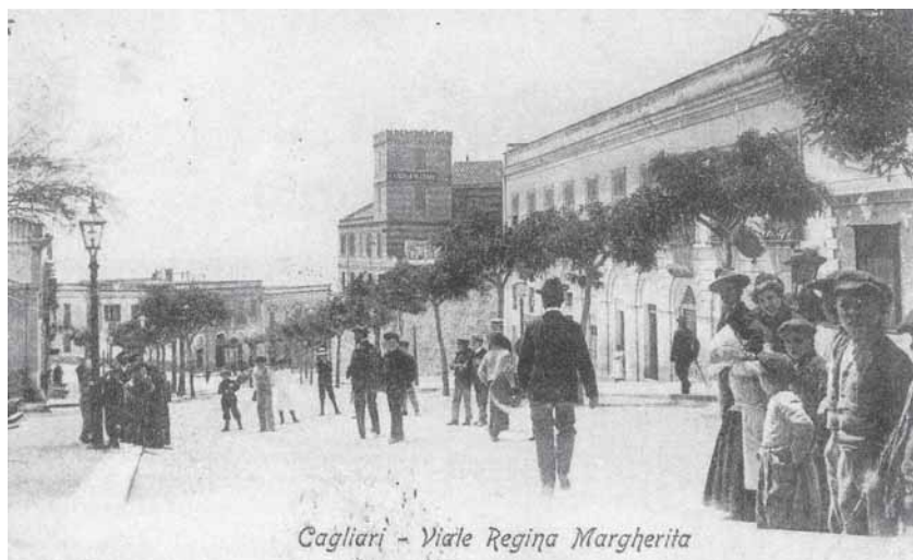
Fig. 4 – Viale Regina Margherita a Cagliari in una cartolina d’inizio Novecento, l’Albergo Scala di Ferro è al centro dell’immagine, l’insegna posta sulla torretta.