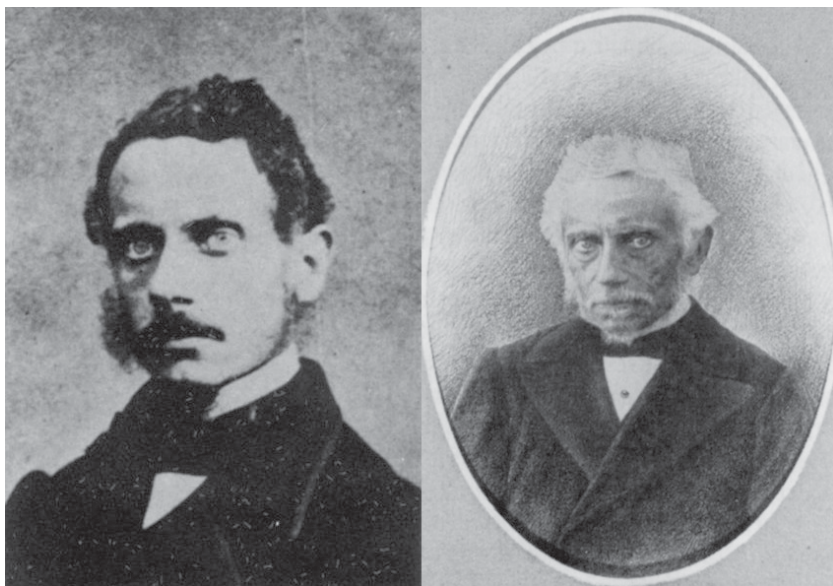
Fig. 1 – I due ritratti noti di Achille Costa in giovane età ed in età matura.