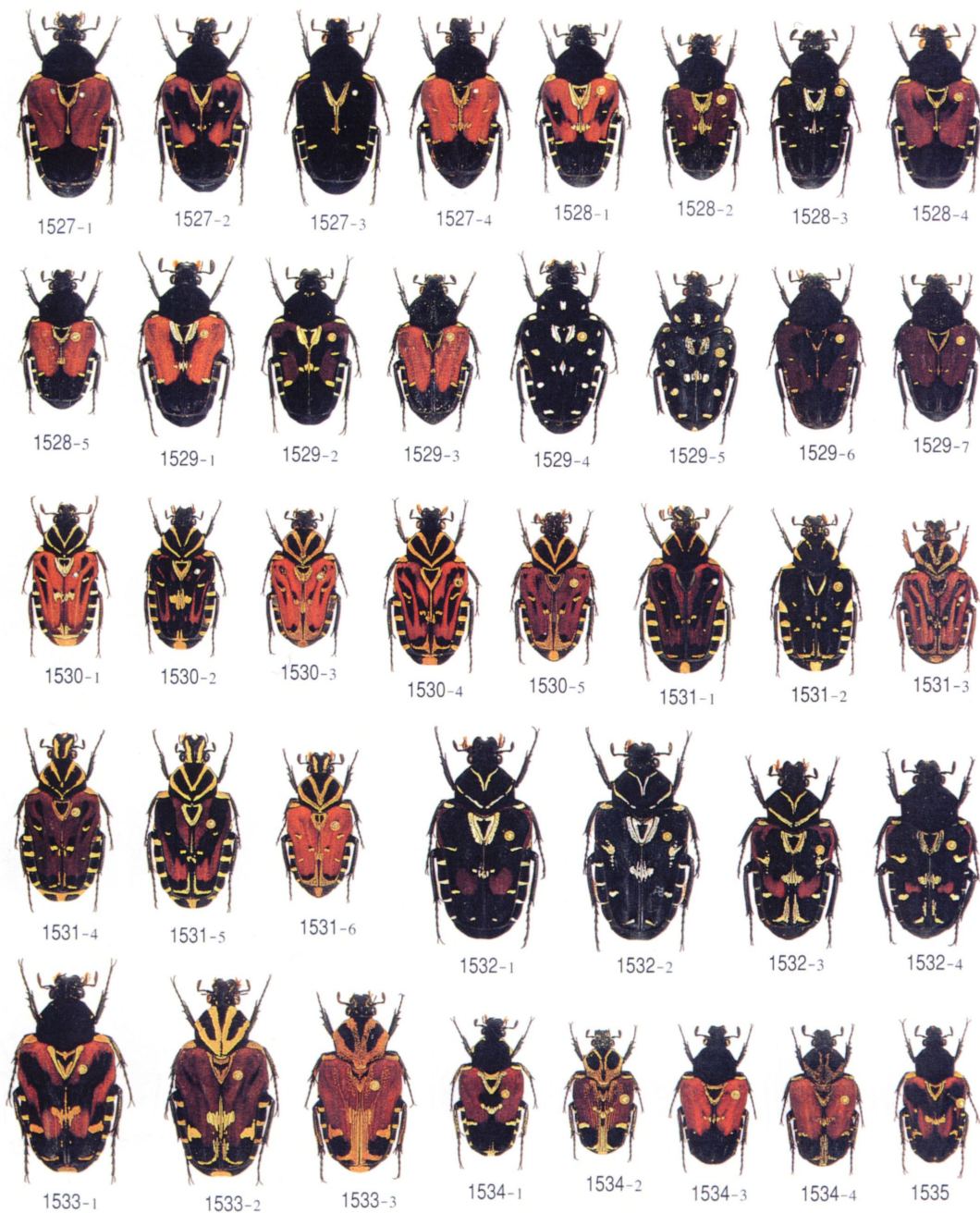
1527. Taenioderes nigrithorax ムナグロエグリハナムグリ 1528. T. borneensis ボルネオエグリハナムグリ 1-3. ssp. borneensis (Borneo), 4-5. ssp. puncticollis (Sumatra) 1529. T. tricolor ミヨロエグリハナムグリ 1-3. ssp. tricolor (1-2. Mindanao I., 3. Negros I.), 4-5. ssp. samarensis (Samar I.), 6-7. ssp. palawana (Palawan I.) 1530. T. aurantiaca スンダエグリハナムグリ 1531. T. picta ピクタエグリハナムグリ 1532. T. abdominalis アブドミナリスエグリハナムグリ 1533. T. coomani クーマンエグリハナムグリ 1534. T. malabariensis マラバリエグリハナムグリ 1-2. ssp. malabariensis (Malay Peninsula), 3-4. ssp. simillima (Thailand) 1535. T. dessumi クロオビエグリハナムグリ