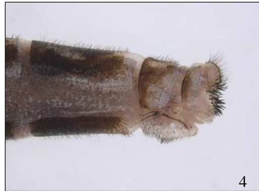
1. Adulto: capo e torace in visione dorsale; 2. Primi segmenti addominali in visione laterale; 3. Apice dell'addome del maschio in visione laterale; 4. Apice dell'addome della femmina in visione laterale.