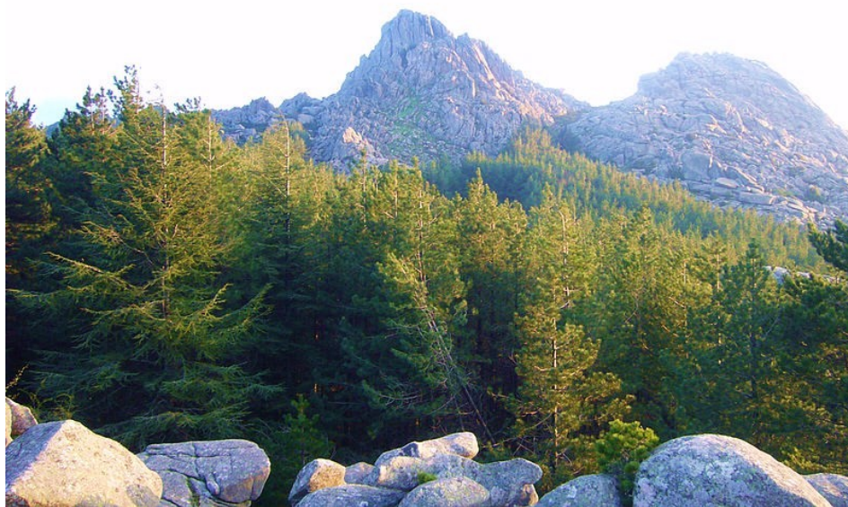
Fig. 2. Habitat di D. italica nel Monte Limbara, Provincia d'Olbia-Tempio, Sardegna settentrionale.